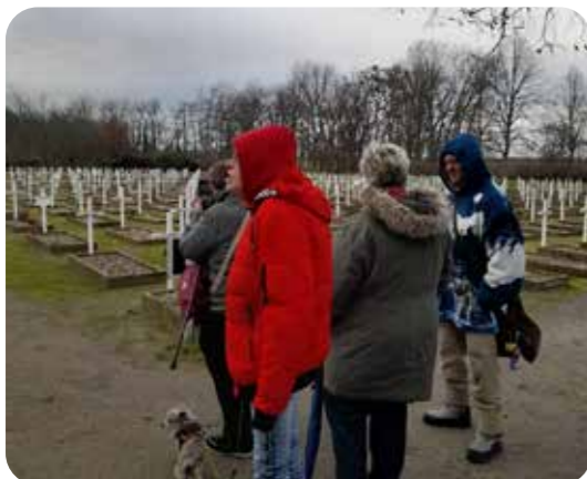
Besuch der Gedenkstätte Feldscheune/Isenschnibbe in Gardelegen