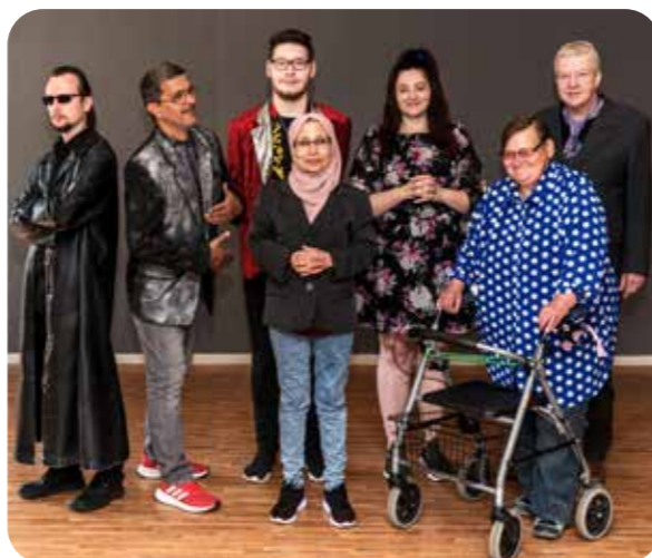
Power People Stadtsee

„Ich schäme mich immer, wenn ich „nein“ sage. Ich sage immer „ja“. Und das Theater hat mir geholfen, dass ich jetzt „nein“ sagen kann, wenn mir etwas nicht gefällt.“