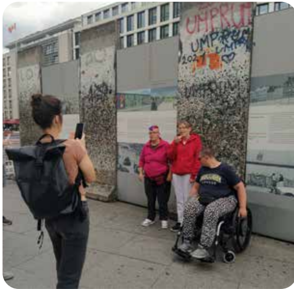
Zweitägige Fahrt nach Berlin und in den Deutschen Bundestag