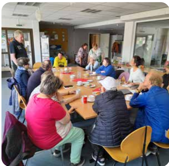
Vortrag eines Teilnehmenden zum Sportfest 1977 in Leipzig