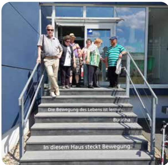
Besuch einer Veranstaltung der Hochschule